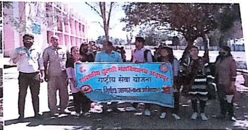
मद्य निषेध रैली का दृश्य